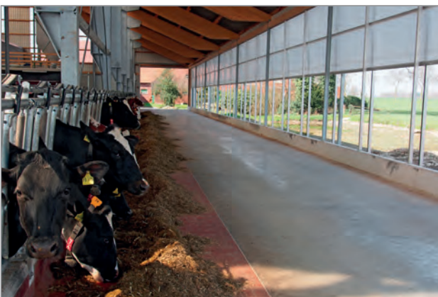
Innenansicht Lubratec Wickellüftung-XL „unten öffnend - mittig wickelnd“

den. Es folgte das Vorbereiten der Plane am Boden bevor diese mit einer Traverse auf die Bögen aufgelegt wurde. Hierfür empfiehlt sich generell ein windstiller Tag. Nach dem Spannen wurden die Windabweiser und die Giebelverkleidungen montiert. Inzwischen haben die Kühe ihren neuen Stall bezogen. Selbst an bedeckten Wintertagen erhalten Sie nun ausreichend Tageslicht und Frischluft, die nicht nur zur Gesundheit der Tiere beitragen, sondern sich zudem leistungsfördernd auswirken.