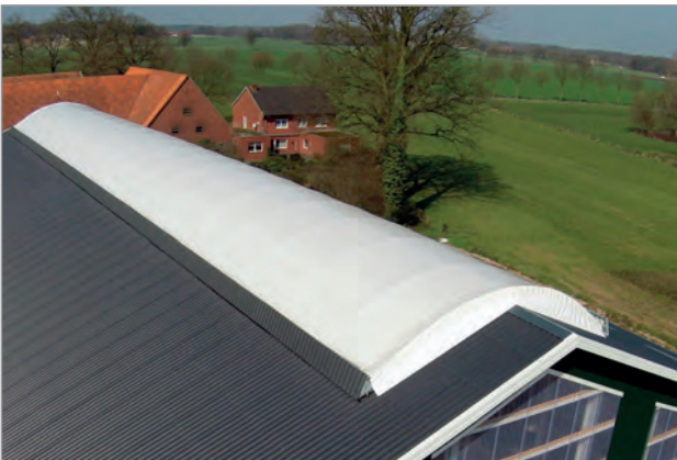
Detailaußenansicht Skytex Lichtfirst