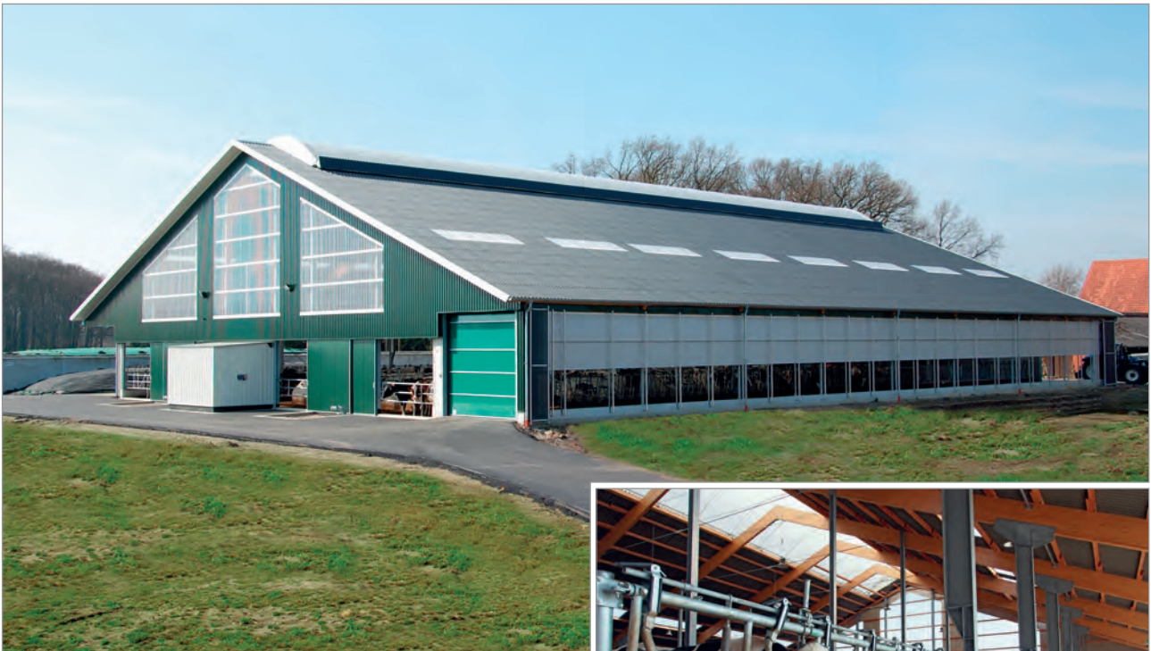
Außenansicht des Boxenlaufstalls mit allen drei verbauten Produkten