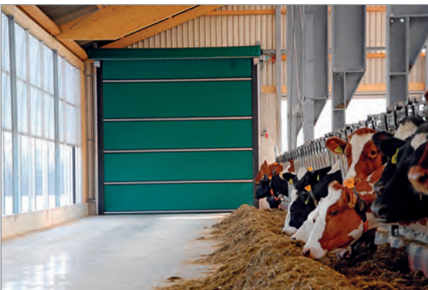
Innenansicht mit geschlossenem Lubratec Stabitor