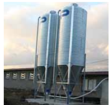
Futtermittelsilo Typ StorageLine