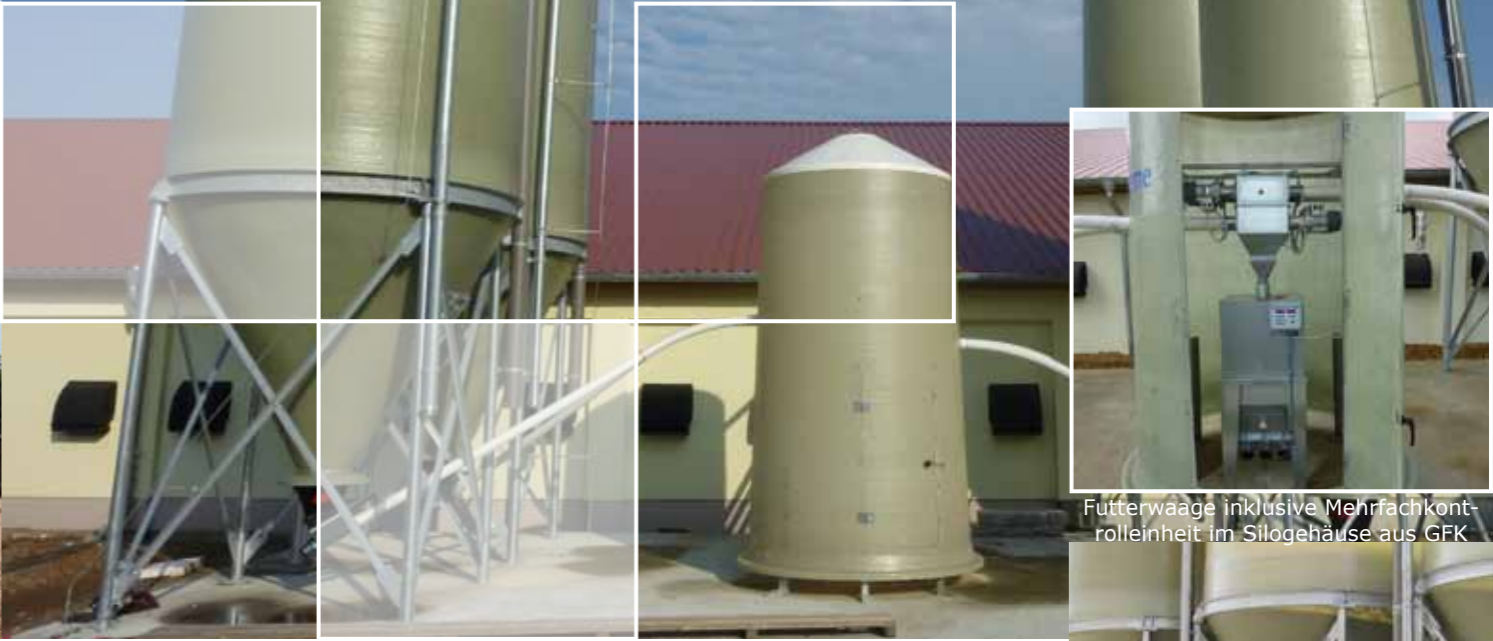
Futterwaage inklusive Mehrfachkontrollereinheit im Silogehäuse aus GFK

Innensilos: Unsere Innensilos bestehen aus atmungsaktiven, staubdichtem und hochfestem Polyestergewebe, wodurch eine gute Futterqualität ohne Verklumpung und Schimmelbildung erreicht wird. Die Silos sind in vielen verschiedenen Ausführungen erhältlich. Das Schüttgewicht beträgt maximal 600 kg/m 3 .