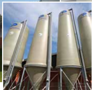
Futtermittelsilo Typ MEX

Hygienischer und sicherer Futtertransport