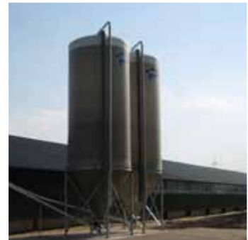
Futtermittelsilo Typ MLR