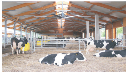
Venti Ø 4,88m