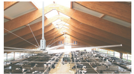
Venti Ø 7,32m

Die sehr langsam laufenden Deckenlüfter erzeugen einen gleichmäßigen Luftstrom in Form eines auf den Kopf gestellten "T".